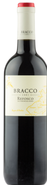
Refosco dal peduncolo rosso Venezia Giulia I.G.T.