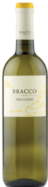
Friulano Friuli Isonzo D.O.C. Rive Alte