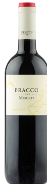
Merlot Venezia Giulia I.G.T.