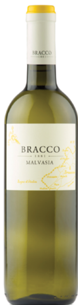
Malvasia Friuli Isonzo D.O.C. Rive Alte